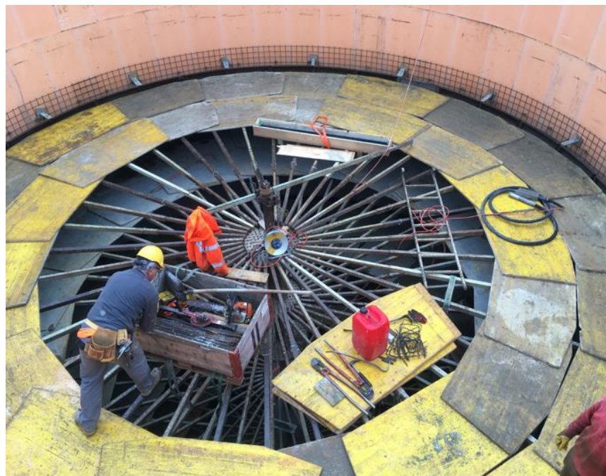
Aperçu à l'intérieur du digesteur. Les contreventements du coffrage intérieur sont visibles.

Assez rare de nos jours : la construction d'un nouveau digesteur ! Un nouveau digesteur est en cours de construction à la STEP Münsterlingen. La STEP a atteint les limites de sa capacité. Après l'extension et la transformation du traitement mécanique et de la biologie, le traitement des boues est complété par un second digesteur. La direction du projet et des travaux de cette nouvelle construction est entre nos mains. Le nouveau digesteur en béton armé - d'une capacité de 600 m 3 - a été achevé en cinq semaines à l'aide d'un système de coffrage spécial. Actuellement, le digesteur est habillé d'une enveloppe en panneaux de tôle de couleur anthracite et sera mis en service en novembre 2020.